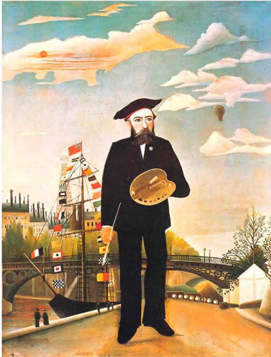
Henry Rousseau, Autoritratto 1890

Paolini omette la propria immagine: dissolve dunque, in omaggio ai suoi interlocutori e mentori, la propria identità nel contesto delle relazioni affettive. L'ego dell'artista, suggerisce, non ha grande importanza: quanto si manifesta nell'opera è il sedimento di una storia condivisa, di una comunità.