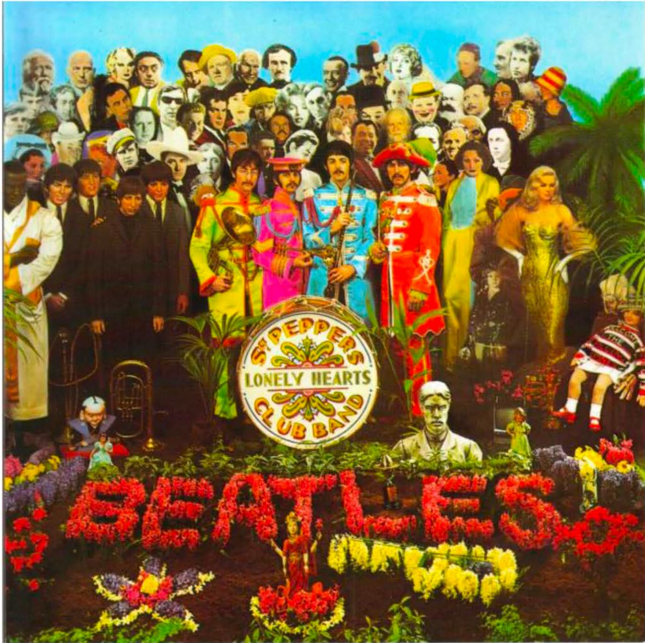
Peter Blake, Copertina di Sgt. Pepper's Lonely Hearts Club Band, 1967

Disegnata dall'artista Pop inglese Peter Blake nel 1967 e eseguita con la tecnica del fotocollage, la copertina beatlesiana oscilla tra ritratto di gruppo e ludica genealogia. Riconosciamo Greta Garbo, Bob Dylan, Charles Baudelaire, Marlon Brando, Oscar Wilde, Lawrence d'Arabia e perfino Stan Laurel e Oliver Hardy. La comunità adunatasi attorno ai Beatles è un Pantheon paradossale cui i costumi di scena conferiscono tratti burleschi. Considerato in termini figurativi, il fotocollage di Blake inventa un modo nuovo e arguto di riferirsi alla tradizione, per metà sprezzatura e per metà omaggio. Il "museo" (per così dire) veste freak.