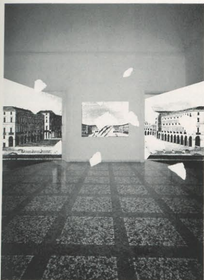
Giulio Paolini, Fuoco fatuo , 1991

Poi è venuto Vedo . Era un campo visivo, una retina proiettata su un muro dove una infinità di punti delimitavano lo spazio che il nostro sguardo può abbracciare frontalmente. Con Vedo succedeva il contrario che nel Giovane di Lorenzo Lotto. Là il quadro di un antico pittore, un oggetto delimitato e preciso, diventava il sestante per la fissazione di un punto astratto nello spazio, che veniva eletto a domicilio dell'identità di tutti. Qui invece, quell'evento immateriale che è la vista, quell'atto senza peso, senza dimensioni, senza misura, senza indirizzo che è la visione, diventava un oggetto, precipitava nella pesantezza della materia, si rattrappiva a cosa. E tuttavia, sebbene rovesciato, il sentiero portava sulla soglia dello stesso domicilio segreto. Bastava mettersi nel punto in cui si era collocato Paolini per misurare l'ampiezza del suo campo visivo, e infilarsi di nuovo nei suoi occhi, diventando ancora una volta un pronome personale traslucido, assoluto e paradossalmente impersonale. Una volta piazzato alla giusta distanza, uno poteva vedere spiaccicata sul muro la propria ragione di visibilità; vedeva il vedere, che è uguale per tutti.