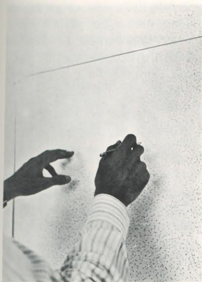
Giulio Paolini, Vedo (la decifrazione del mio campo visivo) , 1969