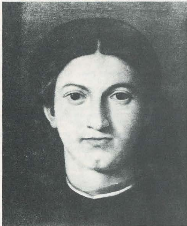
37 / Disegno geometrico, 1960