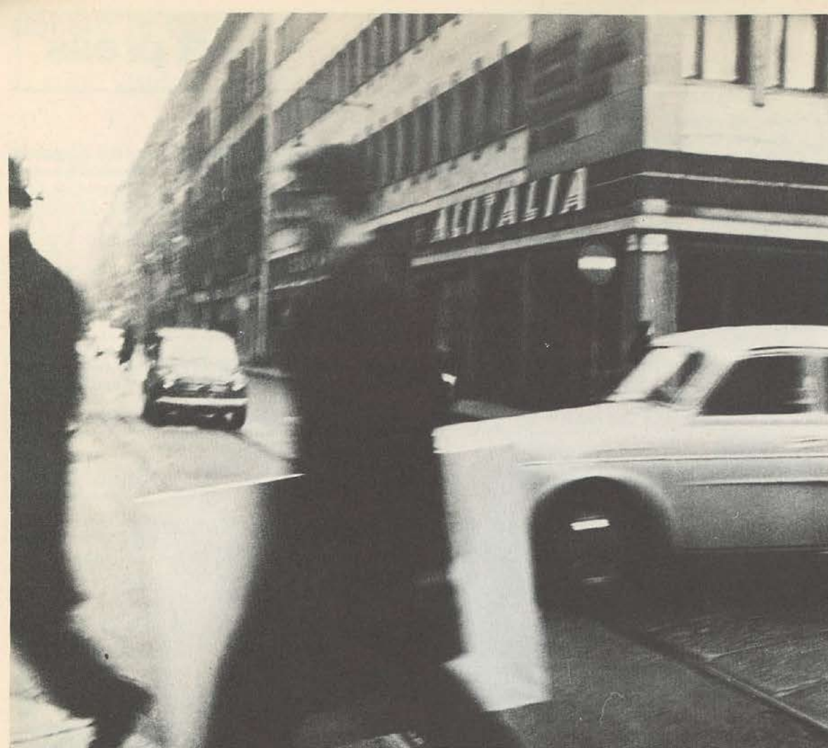
Diaframma 8. Toile sensible. 1965

Parmi ceux-ci - et après la structure propre au tableau Paolini admet l'iconographie que l'histoire de l'art fait préexister aux choix individuels d'un artiste. En 1962-63, apparaissent des « citations » iconographiques d'œuvres de Perilli, Schifano, Novelli, mais pas seulement d'artistes contemporains ; au travers de reproductions d'art, l'artiste passe d'un portrait de Bronzino à un « Portrait présumé de Pirro » (1963) ; la reproduction du portrait, dû au premier, d'Éléonore de Tolède, est superposée, sans être intégrée, à un châssis collé en évidence ; le portrait présumé de Pirro est collé sur l'envers du tableau dont la surface visible est constituée d'un papier