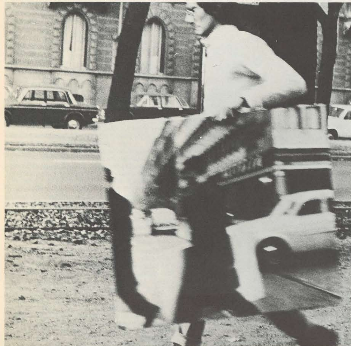
D 8 67. Toile sensible. 1967