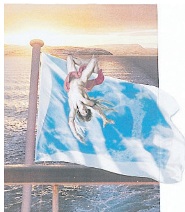
IL MITO L'opera di Paolini «La caduta di Icaro». A destra, «In scena»

Alla Galleria di Alfonso Artiaco la mostra dell'artista genovese che, 80 anni appena compiuti, presenta i suoi ultimi lavori. Tra caducità della bellezza e fascino delle rovine, caduta di Icaro e inquietudini da pandemia, c'è l'omaggio a De Chirico