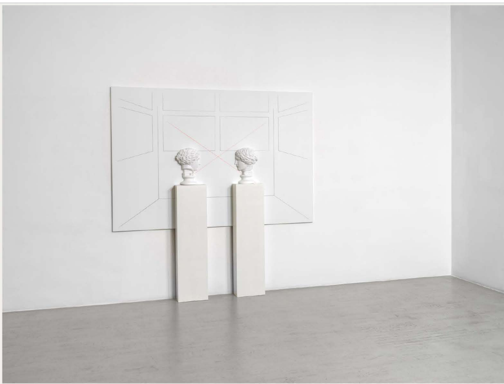
Vis-à-vis (Amazzone).