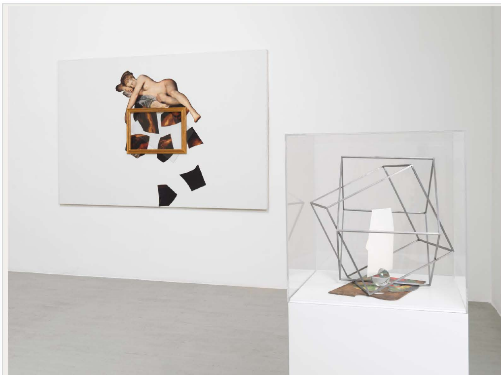
Giulio Paolini, Fuori quadro, veduta parziale della mostra, marzo 2021, Alfonso Artiaco, Napoli.

Più che una differenza è una parentela “acquisita” tra due soggetti: uno, l’antico, distaccato e più austero; l’altro, il classico, più sereno e discorsivo. Entrambi sempre presenti e comunicativi.