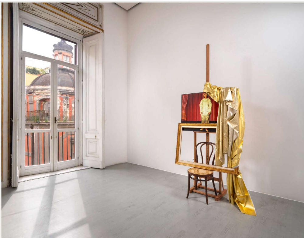
In scena (Gilles) .

Ancora, una delle opere centrali della mostra è l'inedita In scena (Gilles) , dove vediamo una fotografia del Gilles che Watteau dipinse in Pierrot, dit autrefois Gilles al centro di un sipario, col quadro a sua volta posto su di un cavalletto posto dietro una sedia con sopra una cornice e una tenda dorata. È interessante questa dialettica tra la dimensione intima dell'artista e quella pubblica, diventata di particolare attualità in quest'epoca di pandemia, di assenza di contatto (col pubblico e non solo). Qual è il Suo atteggiamento nei confronti del tempo che stiamo vivendo?