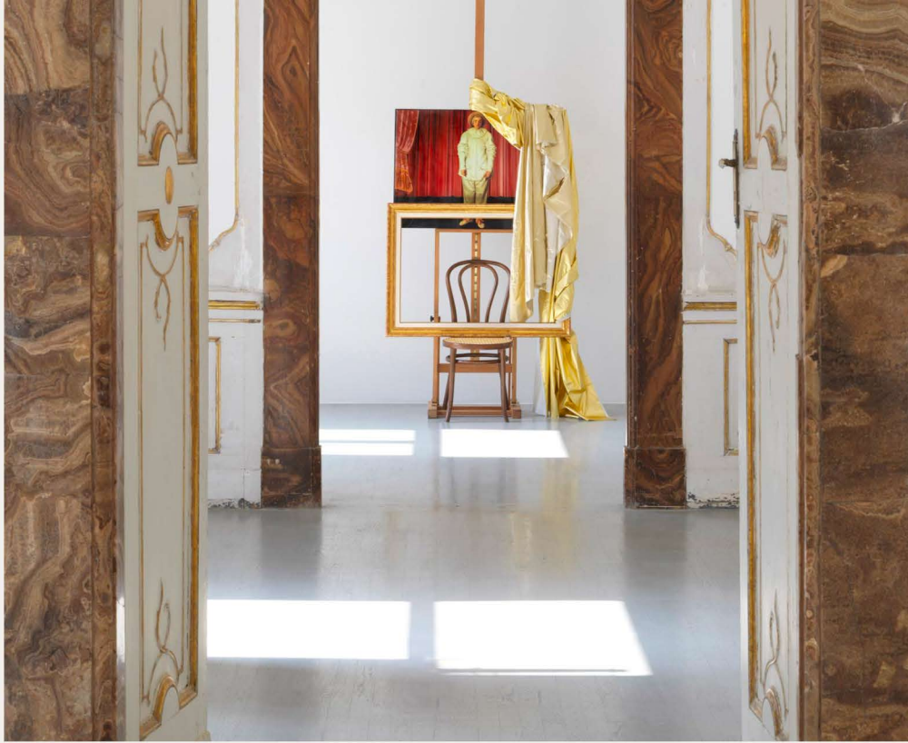
In scena (Gilles) . Foto: Grafiluce