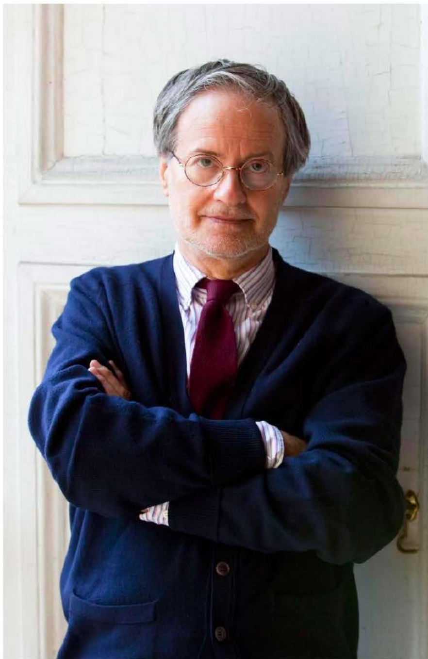
Giulio Paolini

Sempre a proposito di teatro, le sue stanze mi fanno pensare agli spazi della mnemotecnica rinascimentale, vere e proprie architetture mentali dove lo studioso o il retore potevano organizzare il sapere e renderlo accessibile e funzionale. Mi chiedo se gli spazi della mostra in corso non abbiano una parentela con quei teatri, e in qualche modo attualizzino quella forma di pensiero visivo, traducendo i phantasmata in entità incarnate, o meglio, oggettificate. Cosa ne pensa?