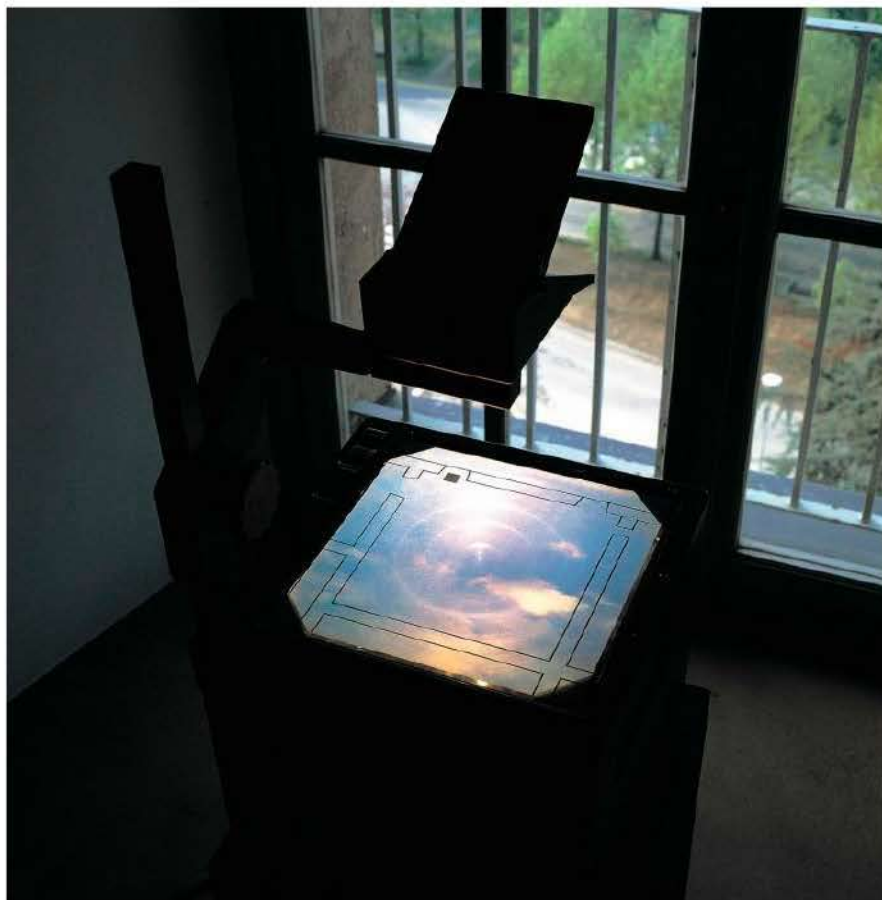
Giulio Paolini No Comment, 1991 Courtesy Fondazione Giulio e Anna Paolini, Torino Foto / Photo Paolo Pellion © Giulio Paolini

rosa, come poté vederla Adamo nel Paradiso, e sentì che essa stava nella propria eternità e non nelle sue parole e che noi possiamo menzionare o alludere ma non esprimere e che gli alti e superbi volumi che formavano in un angolo della sala una penombra d'oro non erano (come la sua vanità aveva sognato) uno specchio del mondo, ma una cosa aggiunta al mondo [...].”