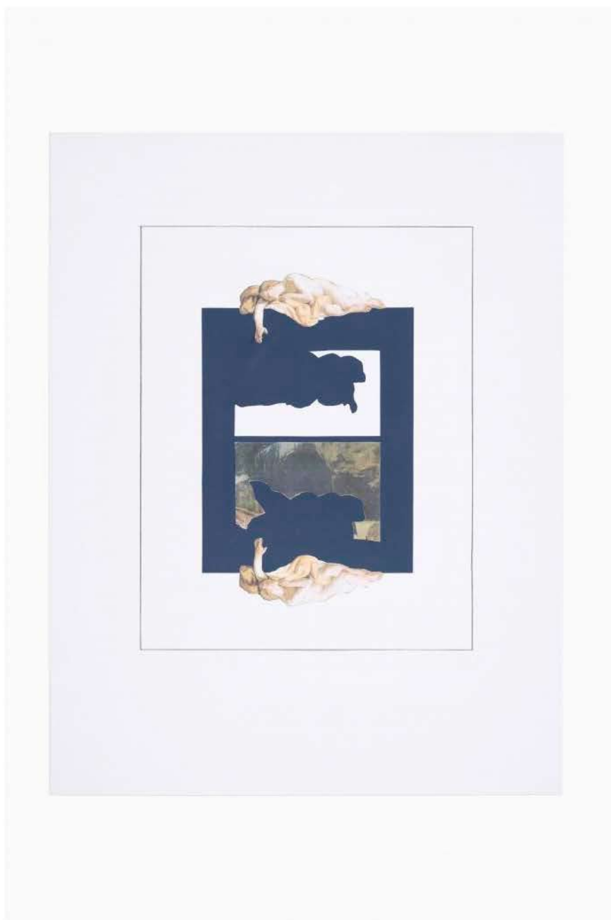
Giulio Paolini L'immagine di un'immagine (Narciso) (The Image of an Image – Narcissus), 2020 Courtesy Fondazione Giulio e Anna Paolini, Torino Foto / Photo Luca Vianello © Giulio Paolini.