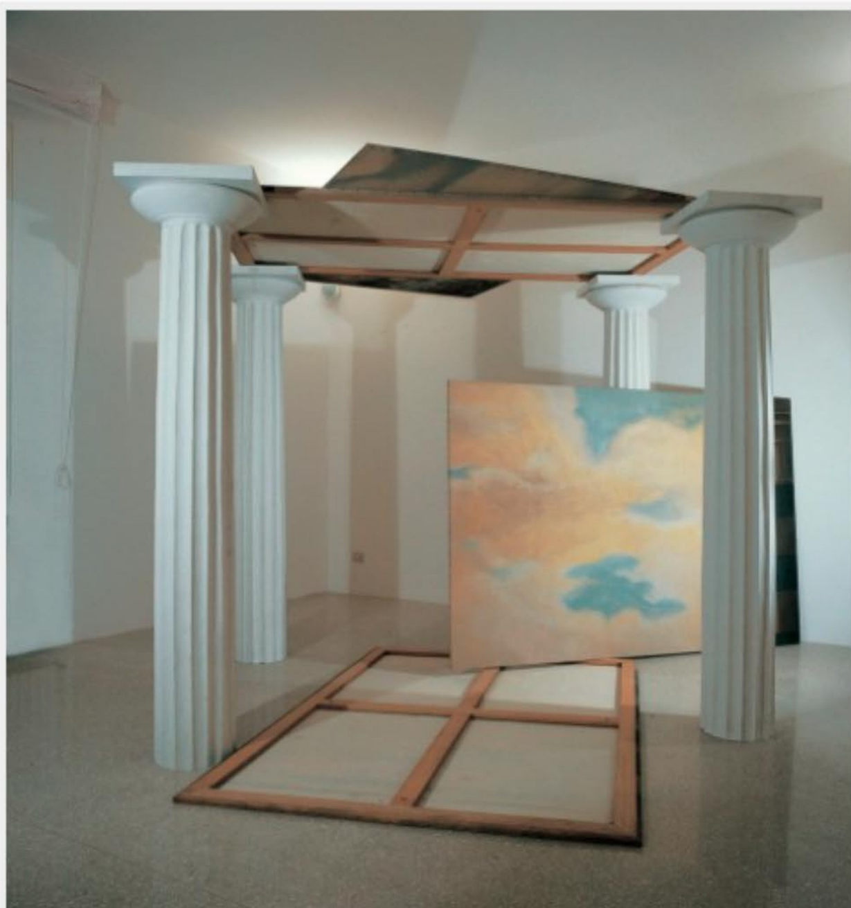
Giulio Paolini, Mnemosine (Les Charmes de la Vie 3-6) , 1981-87 – Collezione privata, Torino – © Giulio Paolini – Proprietà dell'artista, Torino, Luparelli

Non c'è alcuna teleologia nella storia dell'arte. Non c'è evoluzione.