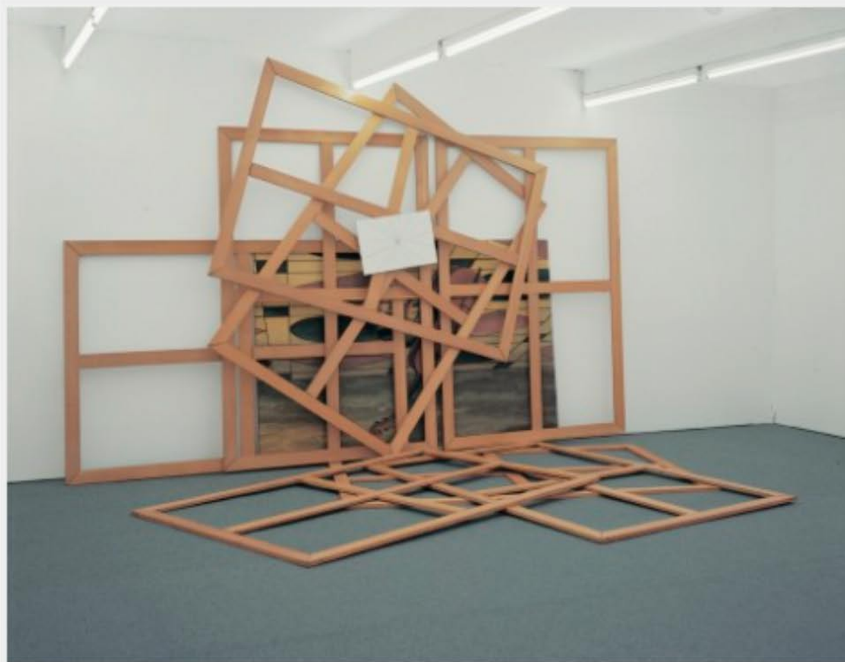
Giulio Paolini, Mnemosine (Les Charmes de la Vie 8), 1981-90 – Proprietà dell'artista, Torino, Luparelli – – – © Giulio Paolini