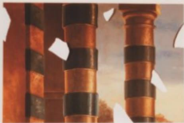
Giulio Paolini, Mnemosine (Les Charmes de la Vie 1) , 1981 – Collezione privata, Torino – © Giulio Paolini