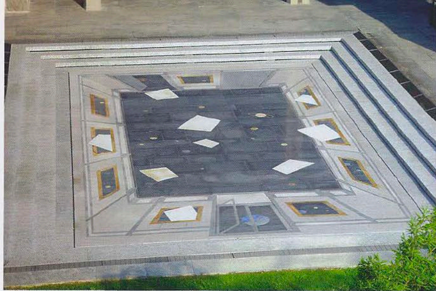
Anni-luce, 2001. Mosaico lapideo policromo. Installazione permanente, GAM, Torino. Pagina a fianco: Paradigma, 2002. Veduta dell'installazione, Castello di Ama (SI).

GP: Più vera proprio perché si astrae dal dato reale, perché se di verità l'artista si deve occupare, questa è la verità dell'arte e non delle cose che l'arte riflette. Detto in due parole, Richter sostiene che debba essere l'autore a infondere verità nell'opera, lui a costruirla. Io, al contrario, ritengo che l'opera possieda già la sua verità, la sua storia, e che all'autore non resti che rivelarla, tradurla in immagine. Non è questione da poco, ma si tratta pur sempre di una discussione in famiglia, corretta e amichevole... Ben altre sono le avversioni (e ne ho)... per esempio la pittura-verità, ambiziosa e sentenziosa, di un Lucian Freud, ora