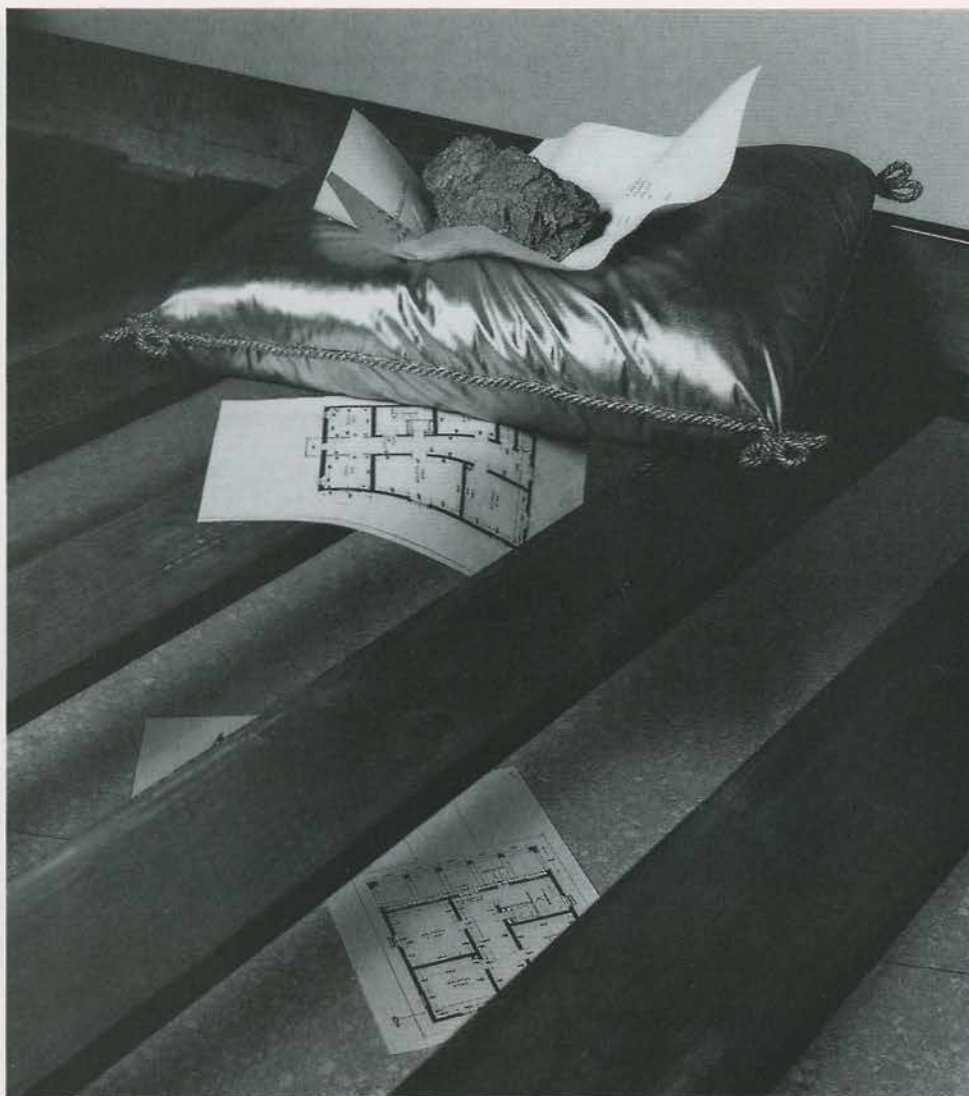
«Le décor change». (Le temple de la gloire). 1983-84. Œuvre réinterprétée lors de l'exposition «Hôtel de l'univers», Villa delle rose, Galleria comunale d'arte moderna, Bologne en 1990. (Détail de l'installation)

tion. Mon œuvre est comme un échafaudage : des éléments identiques ou proches sont utilisés dans des situations et à des niveaux différents. Je peux faire un parallèle entre De pictura (1979) et Contemplator enim (1991) : dans les deux cas, l'espace représenté est impraticable parce que la figure regarde la surface du seul tableau retourné que nous, spectateur, nous ne pouvons voir. Nous ne sommes pas là, nous ne pouvons pas voir mais quelqu'un le fait pour nous. Le personnage est représenté dans la scène.