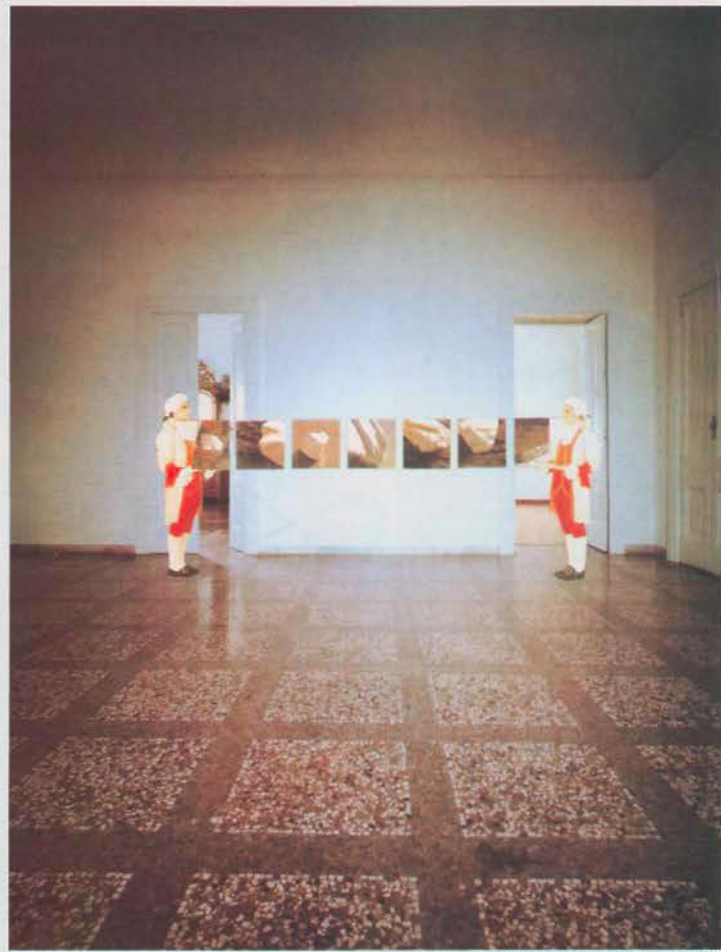
«Contemplator enim III» : «La citta proibita» (La ville interdite). 1990. Collage