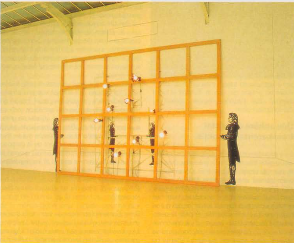
«Ni le soleil, ni la mort». 1989. 1300 x 400 x 25 cm.

Cet ouvrage que vous évoquez contient la représentation d'un espace habité, subjectif puisqu'il s'agit de l'entrée de votre appartement, mais l'auteur, l'artiste, est absent et seules les œuvres sont présentes.