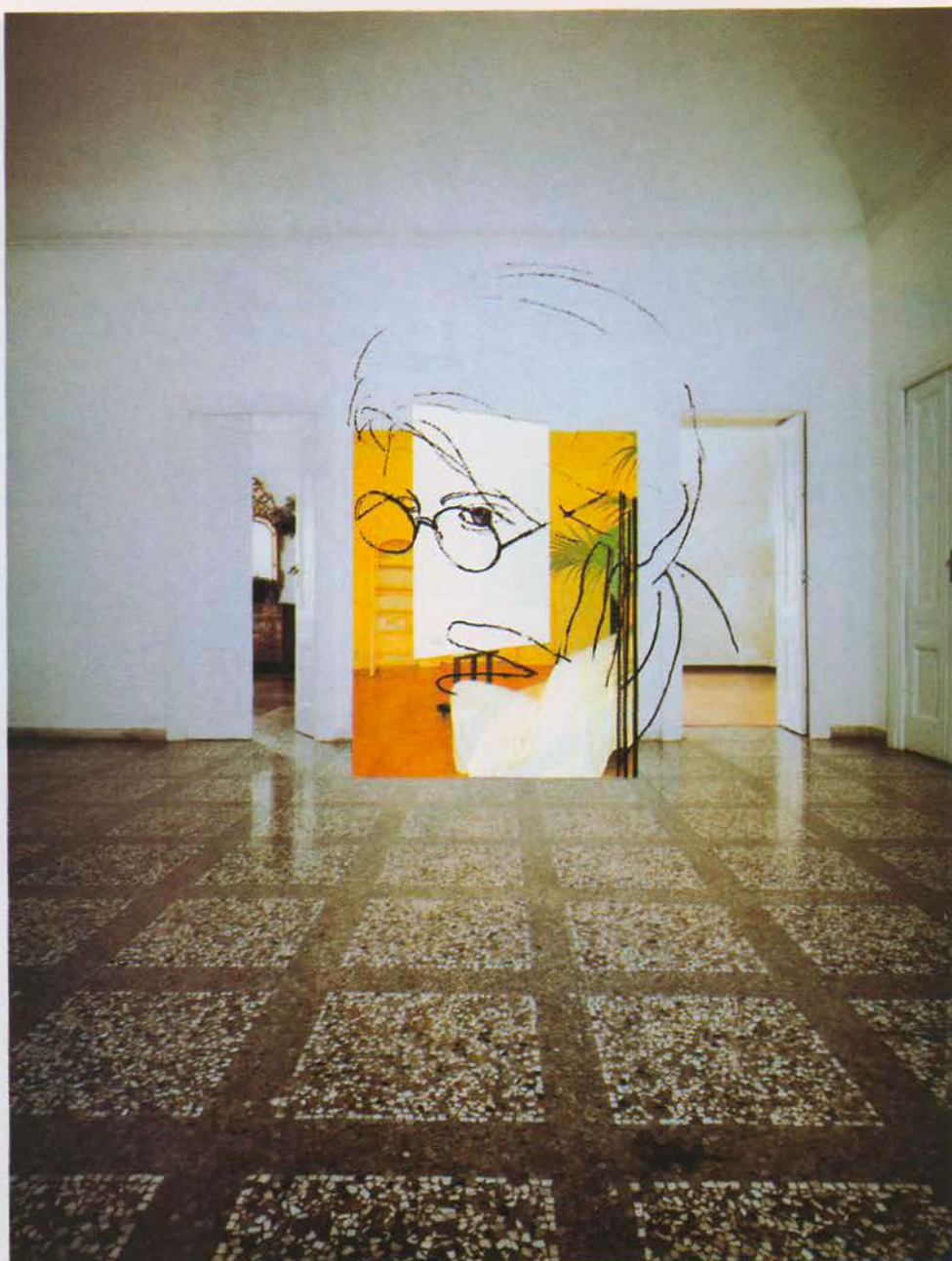
«Contemplator enim V : L'ospite». 1990. Collage

Vous avez écrit en 1984, dans Le lieu de la représentation : «L'artiste et l'œuvre sont complémentaires, non séquentiels. Pour l'œuvre, il est essentiel, pour qu'elle existe, de saisir le regard qui la révèle — peu importe que ce soit le regard de l'auteur ou le regard du spectateur ; de la même façon, pour l'artiste, pour sa sauvegarde à lui, est nécessaire la découverte de quelque chose (l'œuvre) qui lui permette de regarder. C'est pourquoi, comme je l'ai dit, ce sont les œuvres qui m'ont pensé, et non vice versa. L'artiste ne pense pas : c'est un naufrage,