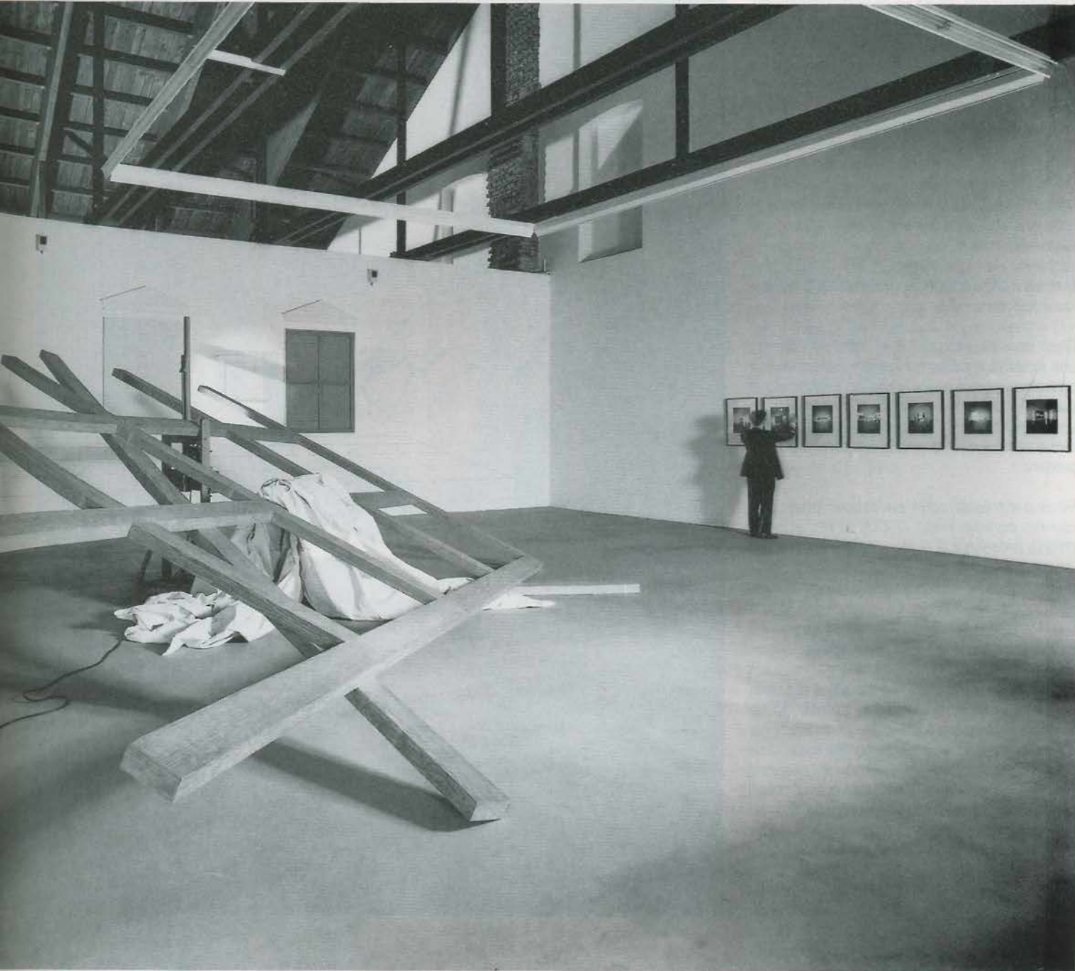
Rivoli en 1991. 1e plan : «Hic et nunc». 1991. Toile, châssis, chevalet, projecteur. 490 x 715 cm. (Dimensions du «Radeau de la Méduse» de Géricault). Mur du fond : moulages en plâtre, crayon, plexiglas. Interprétation des 7 images du livre «Contemplator enim», présentées sur le mur de droite.

Il me semble que depuis le début votre travail touche à des points qui concernent l'art et son histoire, sa perception. Le tableau, le châssis, le cadre, la vision perspective. En vous retirant dans un espace intime qui révèle le moi, y compris le moi de l'artiste, n'affirmez-vous pas quelque chose de nouveau ?