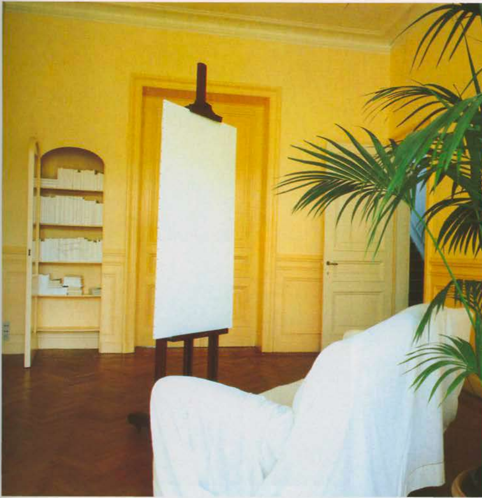
«L'ospite». 1986. (Exposition «Chambres d'amis», Museum van Hedendaagse Kunst, Gand)

Dans Rialto, exposé au Studio d'arte Barnabo à Venise en 1990, tout est suspendu, les deux châssis sont sens dessus dessous : c'est l'inconfort pour le spectateur qui veut regarder les tableaux. Le livre qui décrit l'œuvre montre des collages, des études, réalisés à partir du tableau de Giovanni Bellini, Allégorie de la Fortune changeante ou Mélancolie, et à partir de différents projets de construction du pont du Rialto. L'analogie est là, entre le pont réel et le pont formé par les deux tableaux.