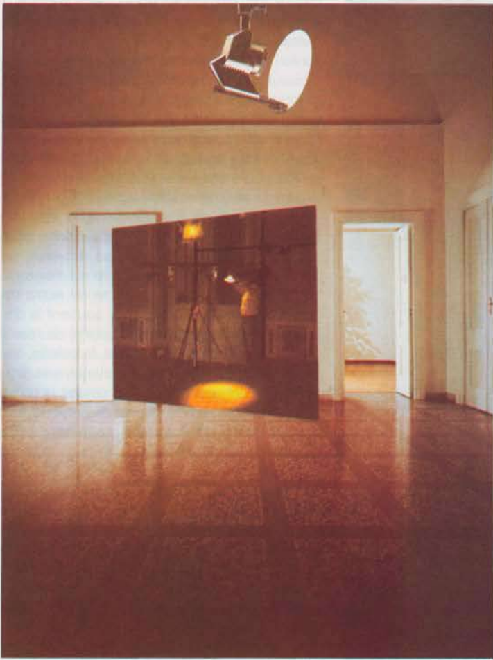
«Contemplator enim II» : «Rovine future» (Ruines futures). 1990. Collage