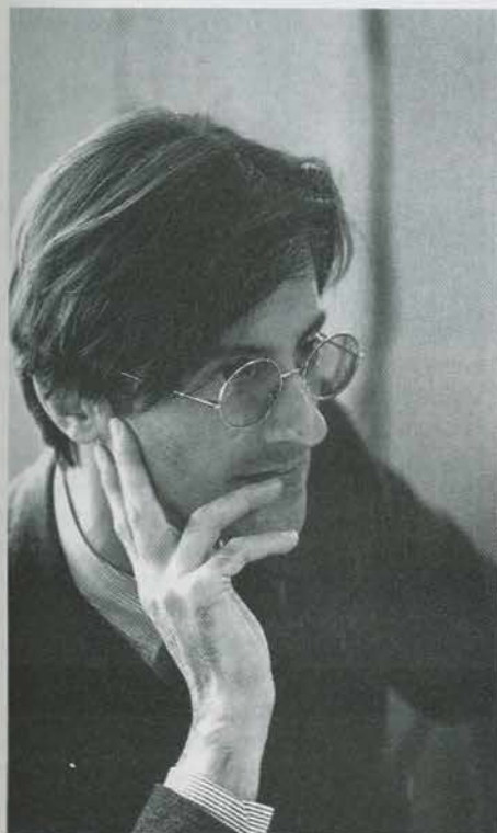
GIULIO PAOLINI.

Dans Contemplator enim , je termine le dernier chapitre par «Ainsi l'auteur quitte la scène. L'œuvre est quelque part intouchable». L'œuvre est alors une sorte de représentation qu'il est inutile de toucher et de chercher à comprendre.