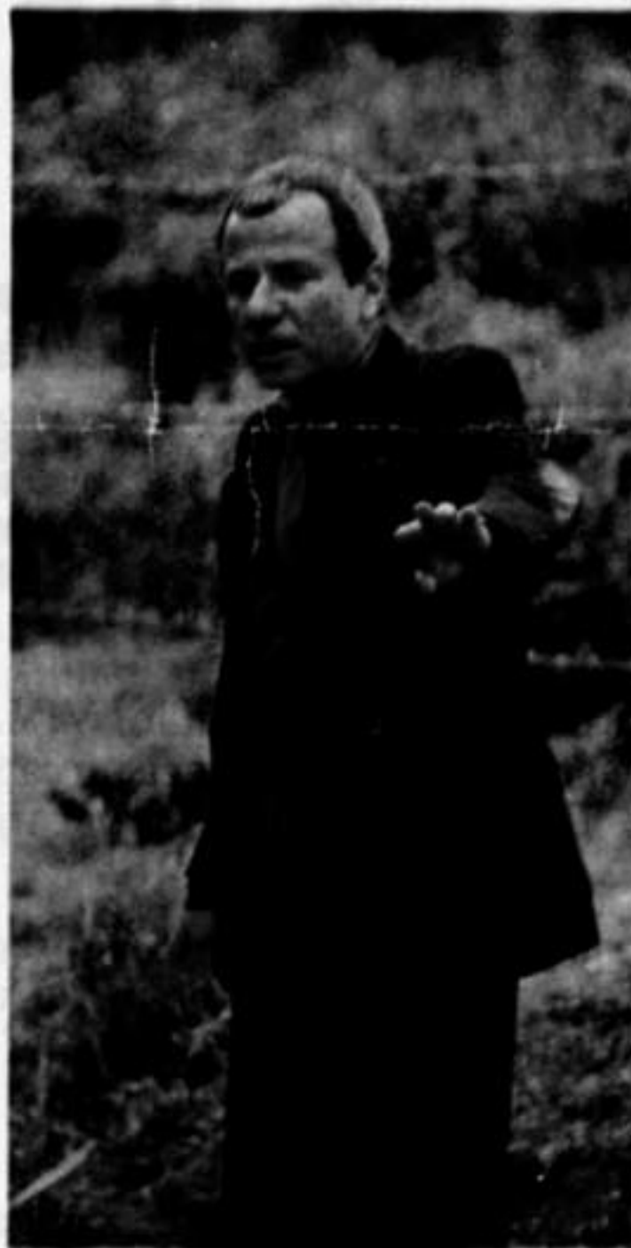
Il critico Achille Bonito Oliva fa ancora parlare di sé

Presentati come traditori, frustrati, emarginati, gli artisti cosa rispondono? Si riconoscono in que-