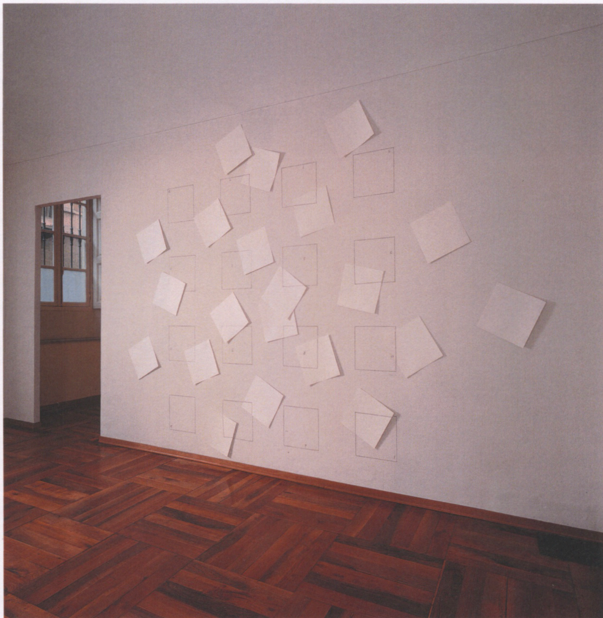
Giulio Paolini Alighiero Boetti , 1986