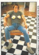
SARAH LUCAS. «SELF PORTRAIT WITH FRIED EGGS»

omaggio alla scrittrice americana Madeleine L'Engle e al suo romanzo di fantascienza A Wrinkle in Time (tradotto in italiano col titolo Nelle pieghe del tempo , Ndr), in cui descrive viaggi attraverso tempi e mondi non identificati, paralleli alla realtà in cui viviamo. Immergendosi in questi piccoli universi audiovisivi lo spettatore capirà cosa voleva dire L'Engle quando scriveva: «Non viaggiamo a nessuna velocità, in realtà ci raggrinziamo». Tentando di trascendere i limiti del tempo le opere in mostra evocano una zona crepuscolare in cui non esistono nozioni né vocabolari prestabiliti». Il regista e artista Robert Wilson, che ha inaugurato la mostra con una performance, chiude il percorso invitando il pubblico ad addentrarsi nelle situazioni utopiche di «Visioni del confine»: 13 installazioni in cui autori come Christopher Knowles , Jonathan Meese o Misaki Hawaii cercano di spezzare i limiti e anche l'idea che questi siano necessari. □ Roberta Bosco