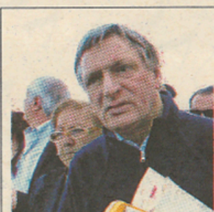
Don Luigi Ciotti

Don Luigi Ciotti presenta la manifestazione anticamorra