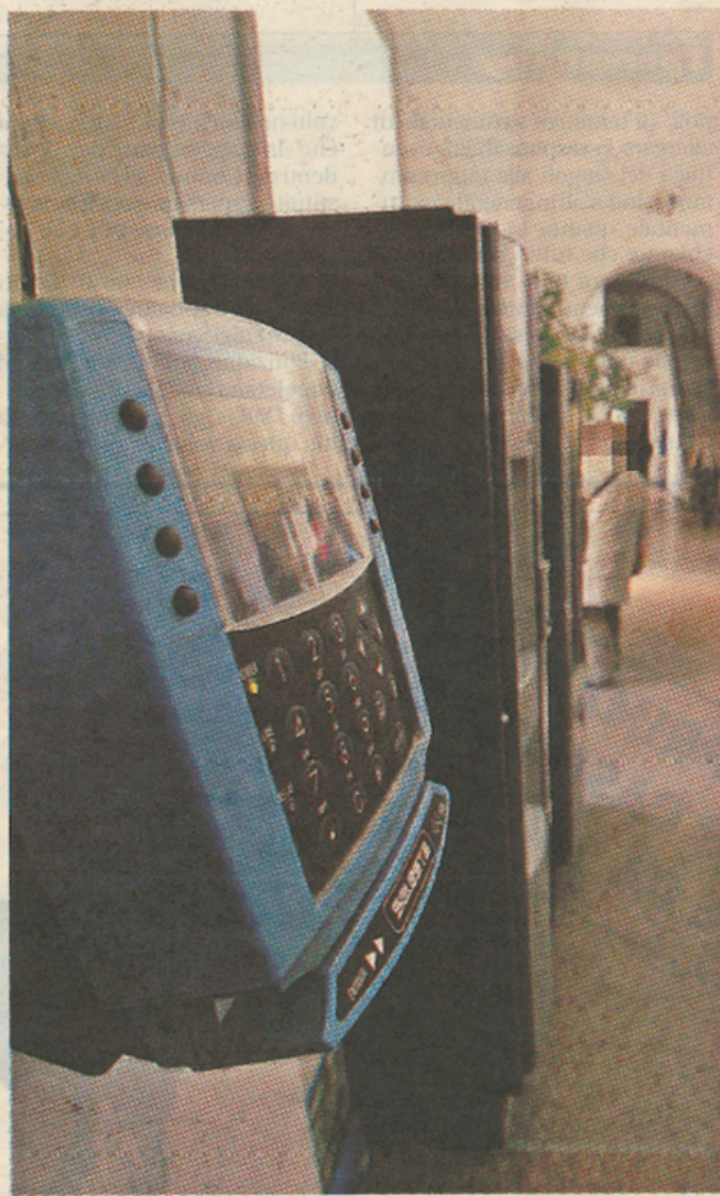
Il marcatempo all'ingresso degli uffici comunali di Portici