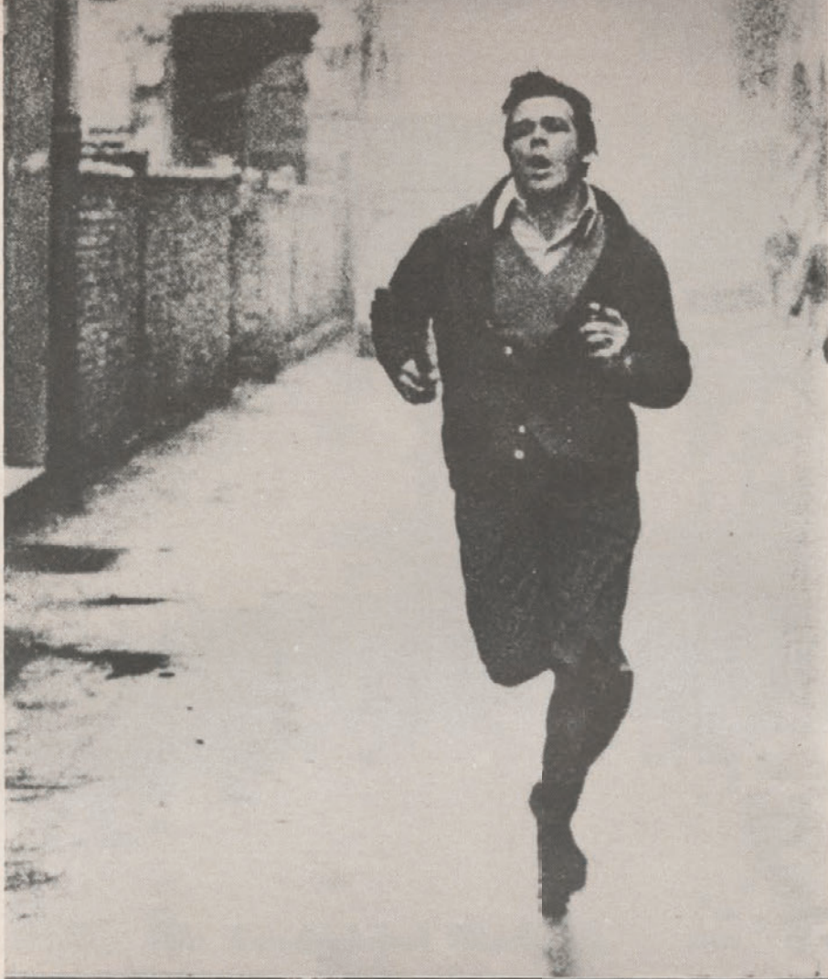
Giulio Paolini Apoteosi di Omero Paolo Casaroli (Renato Salvatori)